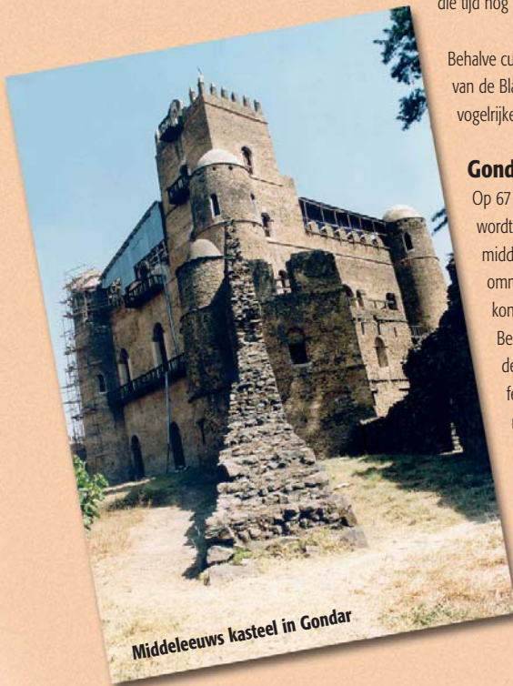
Middeleeuws kasteel in Gondar

Sinds de 16e eeuw komen reizigers die terugkeren uit het noorden van Ethiopië terug met verhalen van oude beschavingen, extravagante koninkrijken en wonderbaarlijke gebouwen. Tot op de dag van vandaag zijn de bezoekers niet minder onder de indruk van hetgeen ze hier vinden. Het noorden staat bekend om zijn rijke historie. Vele orthodox christelijke koningen en prinses hebben tussen de 13e tot de 17e eeuw een rijke erfenis achtergelaten in de vorm van talrijke paleizen, kastelen, kloosters en kerken. In de omgeving van Gorgora is veel van deze historie te bekijken. Interessant is dat tradities en leefgewoonten uit die tijd nog altijd ongewijzigd in vele kerken en kloosters voortleven.