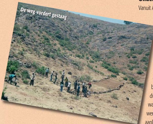
De weg vordert gestaag