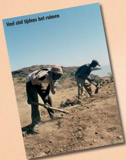
Veel stof tijdens het ruimen

Zij zullen een volledige blauwprint verzorgen van de lodges, incl. begroting voor de materialen, de bouw en de benodigde voorzieningen (water, zonne-energie). Dit in totaal voor een kleine zevenhonderd euro. Wij hebben momenteel regelmatig contact met hen en bij goed werk mag deze architect ons verdere siteplan ook uitwerken.