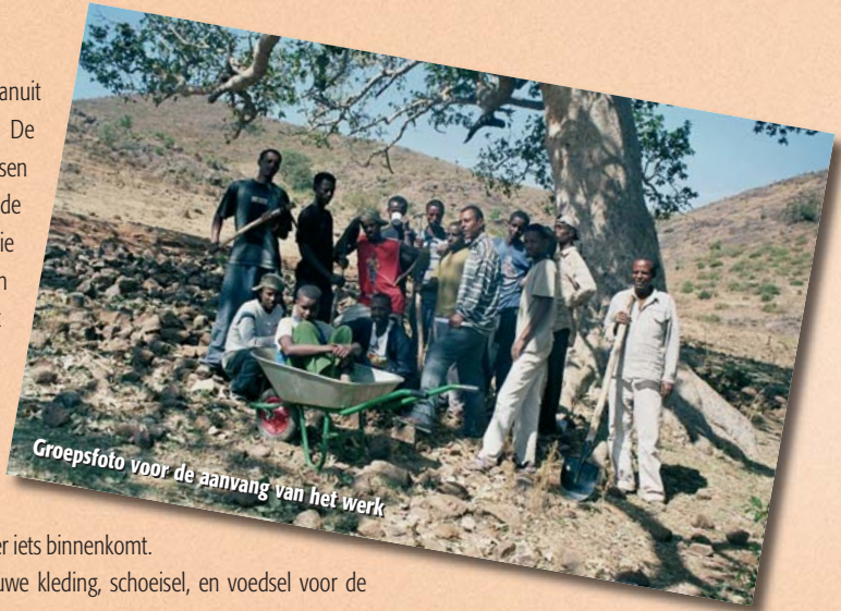
Groepsfoto voor de aanvang van het werk

We kijken terug op een goede start van ons werk in Gorgora. Dankzij uw steun liggen de weg en het terrein klaar voor de investeringen die we in september gaan doen (kampeerterrein, toiletgebouwen, lodges). En nog belangrijker: veel dorpbewoners hebben nu al eten en kleding kunnen kopen dankzij uw bijdrage aan de stichting. Namens de bewoners van het dorp en het nieuwe personeel willen we u als donateur nog eens hartelijk bedanken voor uw steun aan het project.