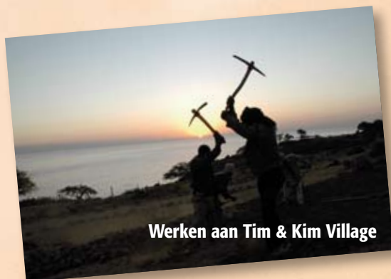
Werken aan Tim & Kim Village

De wereldwinkel Heerhugowaard organiseert op zaterdag 19 april een markt waarbij in Middenwaard verschillende hulporganisaties het winkelende publiek informeren over eerlijke handel. Ook wij staan tussen 8.00 en 17.00 uur met onze Tim & Kim Village stand op één van de 'pleintjes' in Middenwaard. Verder staan we woensdag 30 april op de vrijmarkt in St. Pancras (op het parkeerterrein van zwembad 'De Bever'). Op de markt kunt u persoonlijk informatie krijgen over de voortgang van project. Ook zijn er bijzondere spulletjes uit Ethiopië te koop.